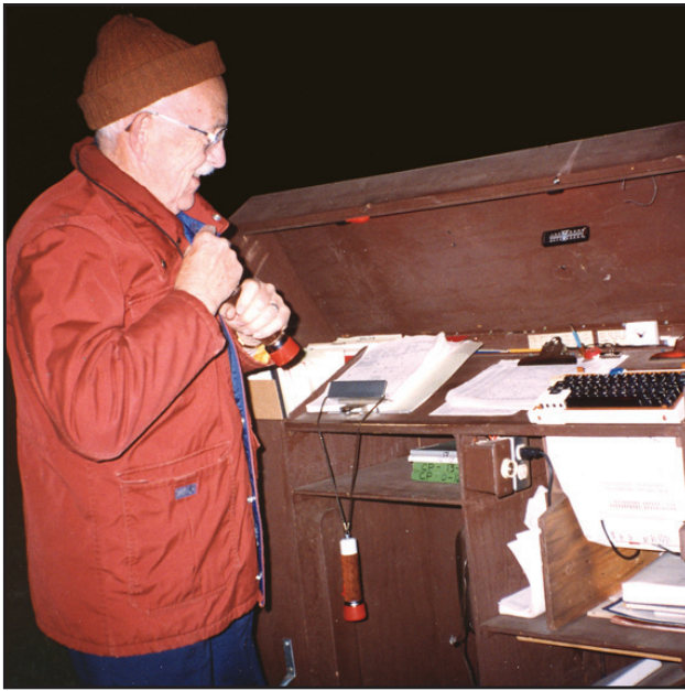
ارابه ی رصد اد هالیچ

بسیاری از رصدگران از یک میز برای قرار دادن نقشه ها، صفحه های رکورد و تجهیزات دیگر استفاده می کنند. همچنین بسیاری یک پناهگاه می سازند یا پوششی بر روی آن می کشند تا وسایل را از پراکنده شدن در باد و در برابر شبنم حفظ کنند. یک نور قرمز کنترل شده ، که دید در شب را تحت تاثیر قرار نمی دهد، برای روشن کردن نقشه مفید است. همانطور که در عکس های زیر می بینید، طی سالها، رصدگران AAVSO راه حل های خلاقانه ی بسیاری برای این مشکل ابداع کرده اند.