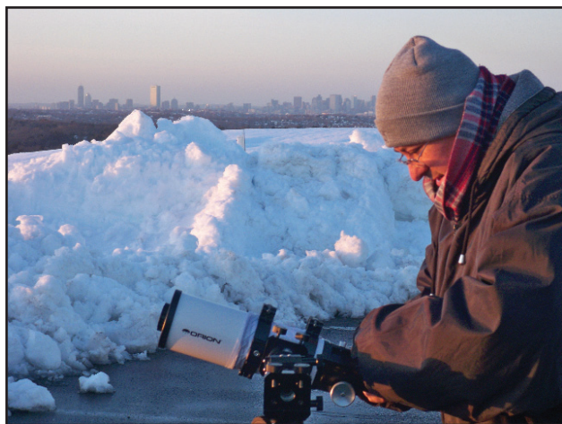
هالدون منالی (MHI) در حال رصد در شهر

منجمان با تجربه ممکن است دوست داشته باشند که در هنگام صبح یا گرگ و میش عصر رصد کنند. رصد در این مواقع خیلی ارزشمند است. به خاطر این که سختی رصد در زمان گرگ و میش منجر به دید کم می شود زیرا ستاره در حال بیرون آمدن یا داخل شدن به شکاف فصلی است. شکاف فصلی زمانی است که در بعضی از ماه ها وقتی ستاره فقط در طول روز در بالای افق قرار می گیرد، اتفاق می افتد. رصدهای بین نیمه شب و سپیده دم برای ستارگانی که در شرق آسمان قرار دارند نیز از ارزش ویژه ای برخوردار است زیرا بیشتر رصدگرها قبل از نیمه شب هنگامی که این ستارگان هنوز بالا نیامده اند، فعالیت می کنند.